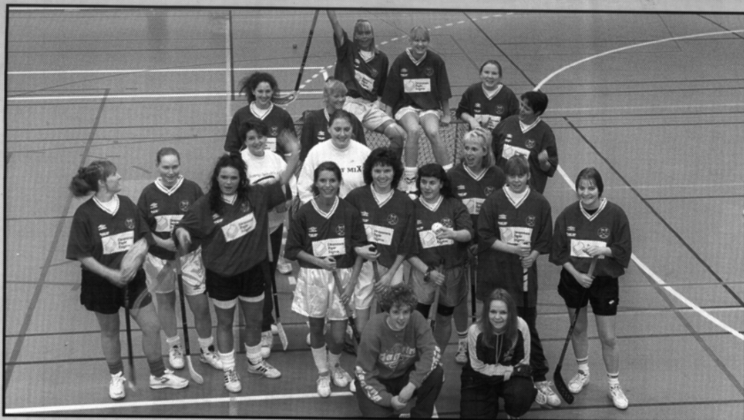
-Vi vil bli flere, sier NOR-92- spillerne, og mener med det flere lag i distriktet. Ikke flere spillere til sin egen klubb.